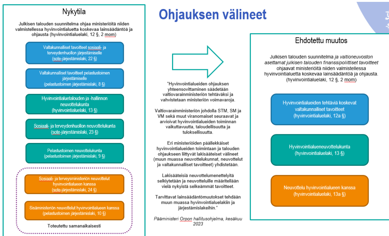
Kuva 1. Ohjauksen välineet

Sosiaali- ja terveydenhuollon järjestämislain ja pelastustoimen järjestämislain säännökset valtakunnallisista tavoitteista sekä neuvottelusta hyvinvointialueen kanssa kumottaisiin ja korvaavat säännökset hyvinvointialueiden valtakunnallisista tavoitteista sekä ministeriöiden neuvottelusta hyvinvointialueen kanssa lisättäisiin hyvinvointialuelakiin.